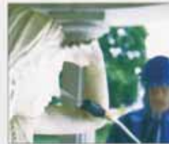
Fassadenreinigung u. Denkmalpflege