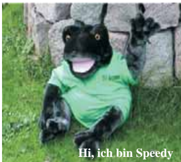
Hi, ich bin Speedy