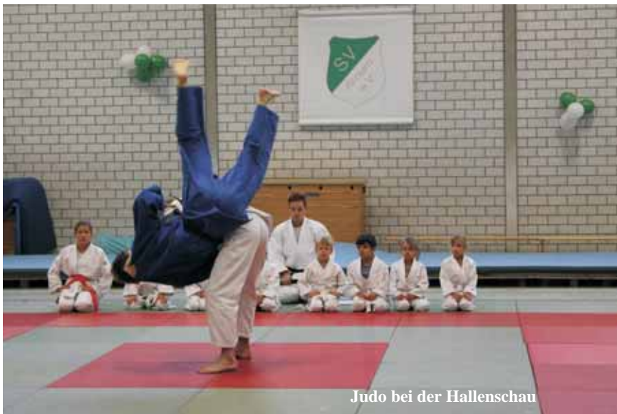
Judo bei der Hallenschau