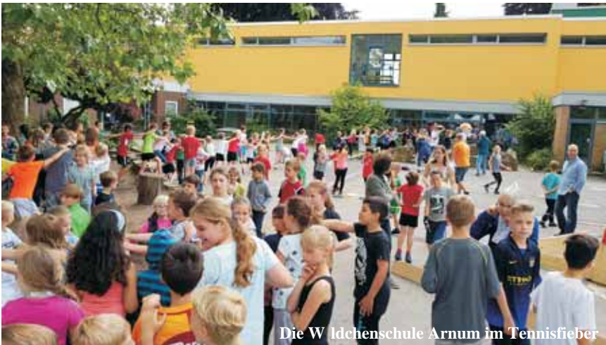
Die Waldchenschule Arnum im Tennisfieber

Wir haben es aber in diesem Jahr durch zahlreiche andere Veranstaltungen geschafft, auch abseits der Turnierserie einiges anzubieten, was in den Jahren davor vielleicht etwas zu kurz gekommen war.