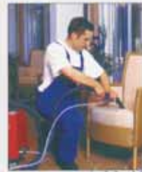
Teppichboden- u. Polsterreinigung